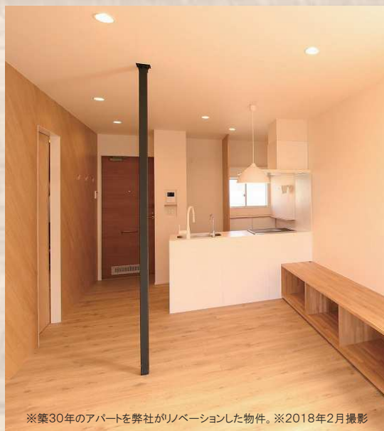
※築30年のアパートを弊社がリノベーションした物件。※2018年2月撮影

セキスイハイムが空室対策法をご提案いたします！ ぜひこの機会にお気軽にご参加ください