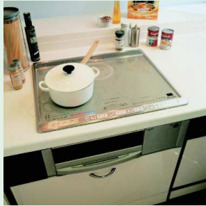
■IHキッチンヒーター

入居される方が求める「快適性」。アパートの住み心地が良いかは、設備によっても大きく左右されます。空室を無くすためにも、入居者様が安心・快適に生活できるような住空間を創り出しましょう。